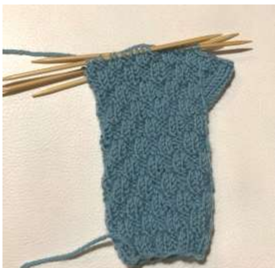
9 10 Bild 8

3 4 In der folgenden 2. Runde die 14 Maschen des Daumenkeils abketten und dabei für 5 eine gerade Abkettkante die Maschen stricken, wie sie erscheinen (rechte Maschen 6 vor dem Abketten rechts stricken, linke Maschen vor dem Abketten links stricken) = 7 34 Maschen. 8