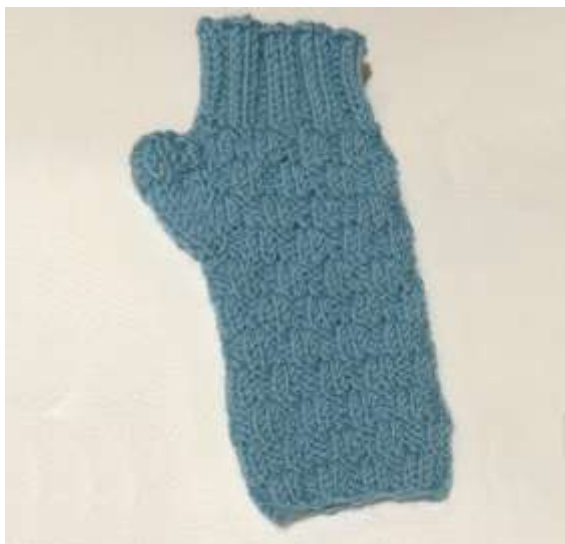
1 2 Bild 9

3 4 Anschließend für das vordere Bündchen das Grundmuster nach 44 Runden ab 5 Anschlag noch 1 x versetzen und danach noch 10 Runden im Rippenmuster 6 stricken. Anschließend alle Maschen locker abketten, wie sie erscheinen.