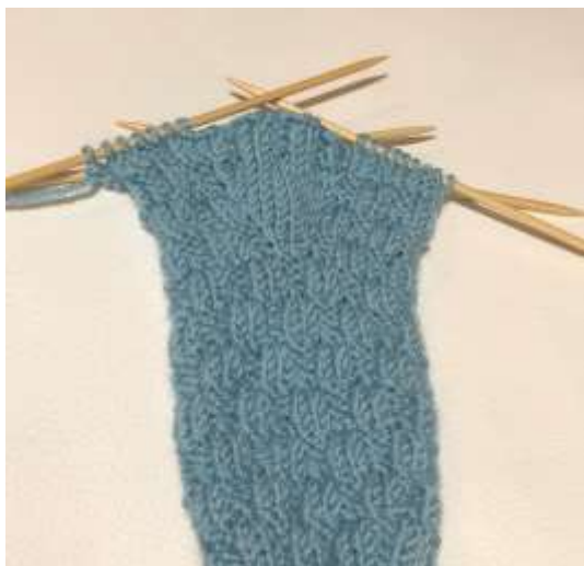
1 2 Bild 7

3 4 In der folgenden 2. Runde die 14 Maschen des Daumenkeils abketten und dabei für 5 eine gerade Abkettkante die Maschen stricken, wie sie erscheinen (rechte Maschen 6 vor dem Abketten rechts stricken, linke Maschen vor dem Abketten links stricken) = 7 34 Maschen. 8